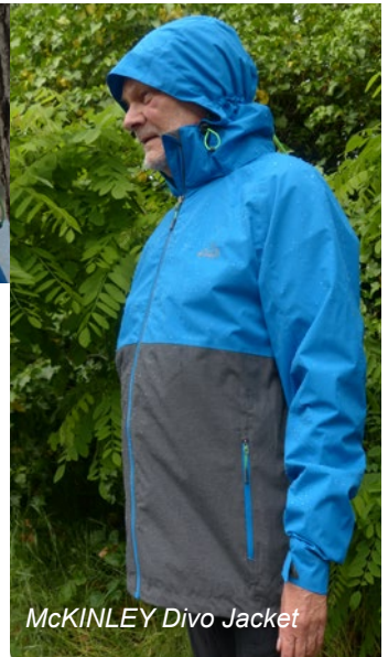
McKINLEY Divo Jacket

Der dritte Kandidat, das Rainstormer Jacket von Columbia , ist ein echtes Leichtgewicht (362 g in Größe XL). Dennoch bietet der auf Basis von C6-Ketten imprägnierte Nylonoberstoff gute Strapazierfähigkeit, Rucksack-Tagestouren bewältigt die Jacke gut. Die 2.5 Lagen Jacke ist mit der Omni-Tech® Membran aus PU ausgestattet. Angaben zur Wassersäule macht der Hersteller nicht, was zum Punktabzug führt. Die Kapuze mit weichem Schild ist zweifach (im Nacken und vorne) einstellbar und sitzt sehr gut.