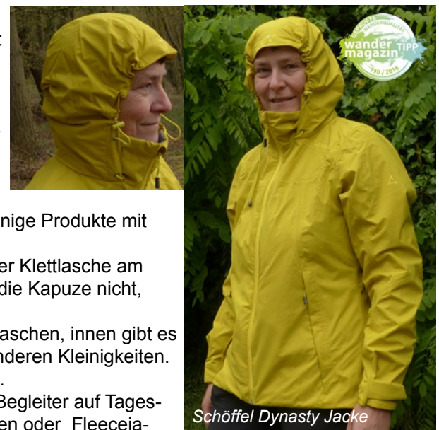
Schöffel Dynasty Jacke

Unser Fazit: Die Schöffel Dynasty ist eine klasse Wanderjacke, die solide Leistung zu einem fairen Preis bietet. Verbesserungswürdig wäre der wenig stabile Schild der Kapuze. Unterarm-Zipps würden den Temperaturbereich der Jacke noch etwas erweitern. Aber auch so kommt die Jacke auf 77% der möglichen Punkte und erhält damit sowohl das Testurteil „sehr gut“ als auch das Wandermagazin Testsiegel