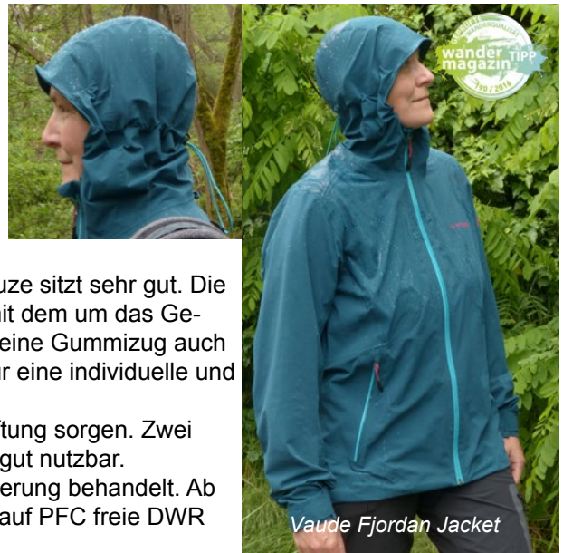
Vaude Fjordan Jacket

Unser Fazit: Das bluesign zertifizierte Vaude Fjordan Jacket ist zwar die teuerste Jacke im Test, bietet dafür allerdings auch eine rundum stimmige und sehr gute Leistung, die fürs Freizeitwandern optimal ist. Eine zweifache Verstellung der Kapuze wäre möglicherweise besser / sicherer und auch eine (kleine) Innentasche würde die Ausstattung noch perfekt ergänzen. Aber auch so kommt die Jacke auf 77% der möglichen Punkte und erhält damit nicht nur das Testurteil „sehr gut“ sondern auch das Wandermagazin Testsiegel.