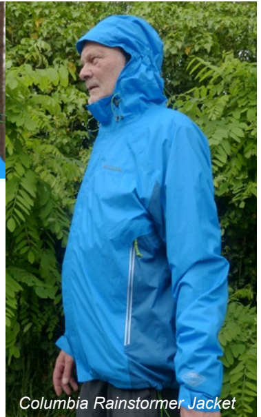
Columbia Rainstormer Jacket

Das Torentshell Jacket von Patagonia ist eine extrem leichte (nur 313 g in Größe L), bluesign® zertifizierte 2.5 Lagen Jacke aus 100% recyceltem Nylon. Sie bietet hohe Abriebfestigkeit und ist dadurch auch für Tages-Rucksacktouren prima geeignet.