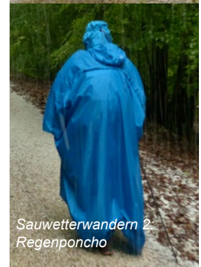
Sauwetterwandern 2 Regenponcho