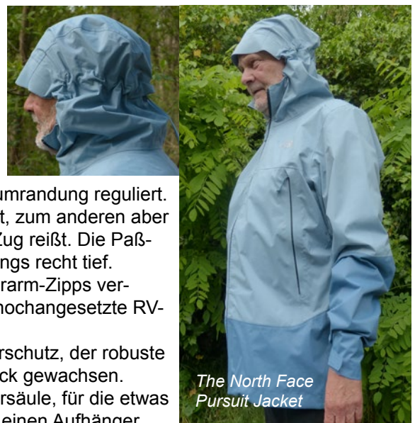
The North Face Pursuit Jacket

Unser Fazit: Das The North Face Pursuit Jacket bietet guten Wetterschutz, der robuste Nylonoberstoff ist auch der Beanspruchung durch einen Tagesrucksack gewachsen. Allerdings gibt es Abzüge für fehlende Angaben zur DWR und Wassersäule, für die etwas steife Haptik und die Kapuzeneinstellung, sowie fehlende Details wie einen Aufhänger. Mit 54% der möglichen Punkte erhält die Jacke das Testurteil „befriedigend“.