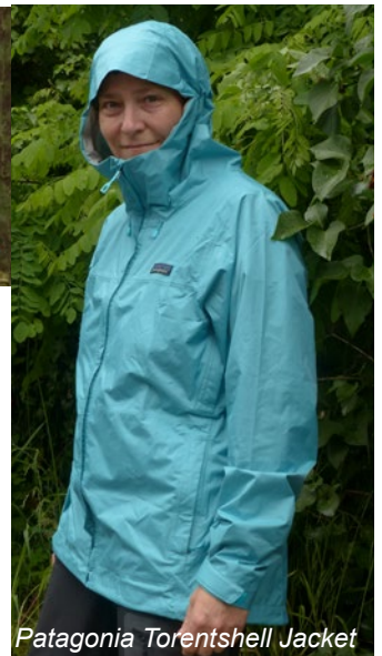
Patagonia Torentshell Jacket