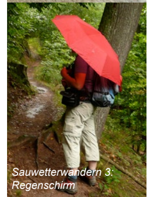
Sauwetterwandern 3 Regenschirm