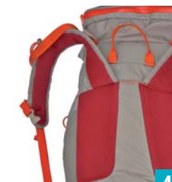
Lafuma XRaid 40 Rücken- polster