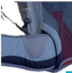
Deuter Spectro 28 SL und 32 Polster Damen- hüftgurt