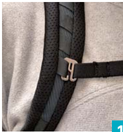
Arc'teryx Axios 33 und 35 Verstellung Brustgurt