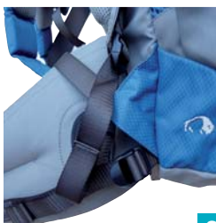
Tatonka Jaca 36 und Leon 38 Lasten- kontroll- riemen (Hüfte)