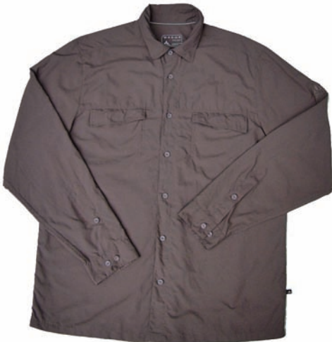
Vaude Santana LS Shirt