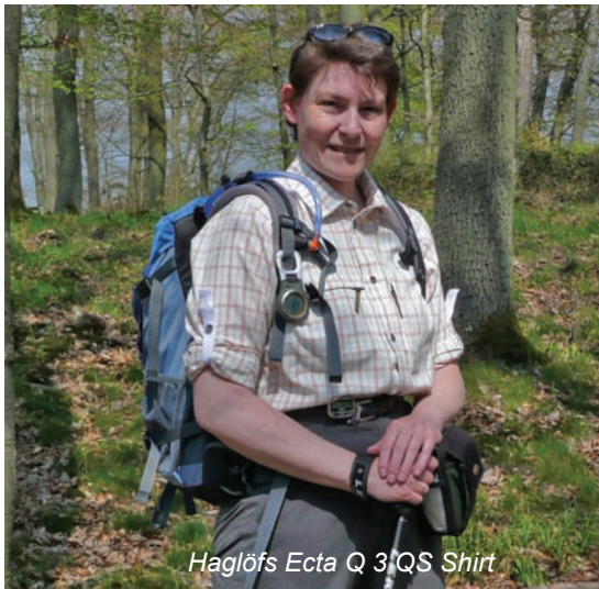
Haglöfs Ecta Q 3/4S Shirt