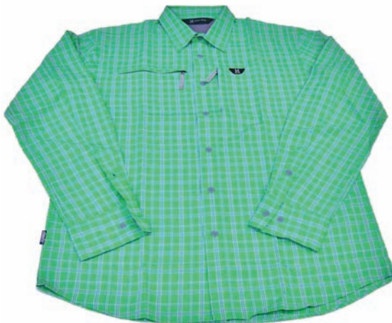
Haglöfs Jura LS Shirt