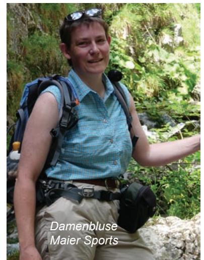
Damenbluse Maier Sports