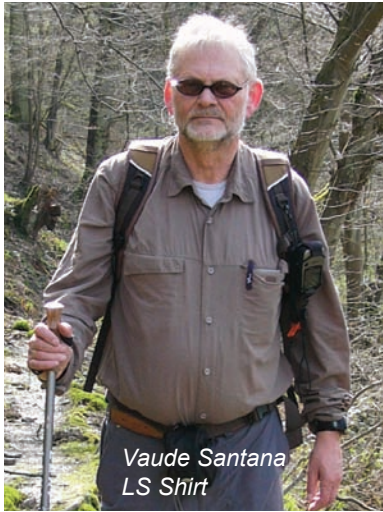
Vaude Santana LS Shirt

Alle gestesteten Hemden bestehen aus verschiedenen Kunstfasern. Maier Sports und Haglöfs setzen auf ein Gemisch aus ca. 85% Polyester und ca. 15% Viskose, was zu einem zwar festen, aber dennoch sehr angenehmen Stoff führt. Noch etwas weicher fühlt sich das aus 100% Polyamid gefertigte Vaude Hemd an. Optimale Dehnungseigenschaften besitzt das aus 100% Polyester bestehende Columbia T-Shirt, das ohne zusätzliche Eigenschaften schlicht und praktisch daher kommt.