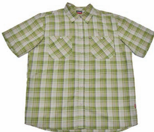
Maier Sports Hemd "Larry"