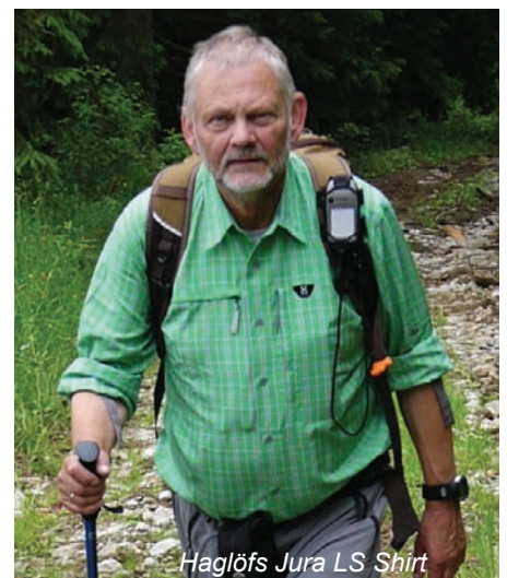
Haglöfs Jura LS Shirt