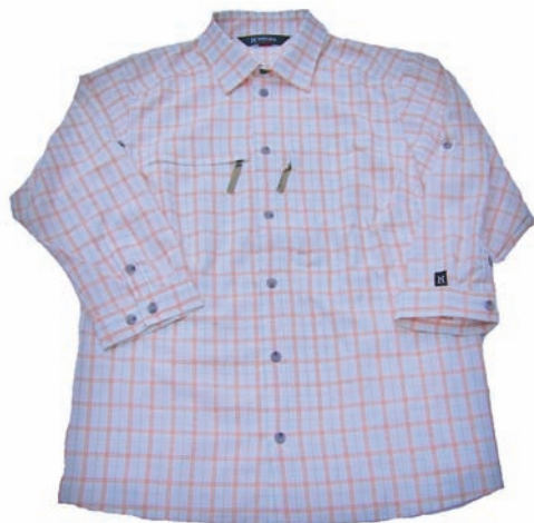
Haglöfs Ecta Q 3QS Shirt