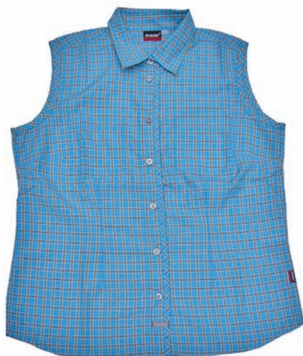
Maier Sports Damenbluse