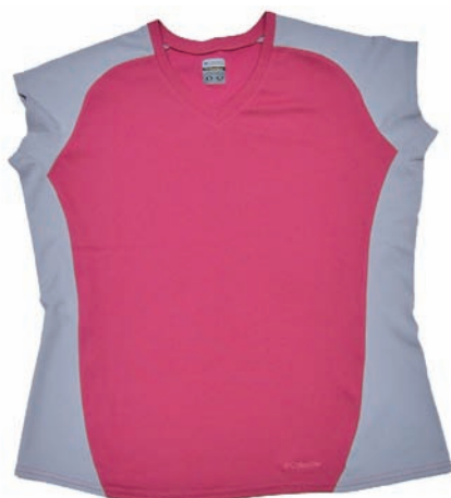
Columbia Sweet Canyon SL Tee