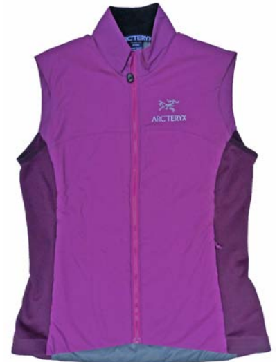
Arc'teryx Atom LT Vest