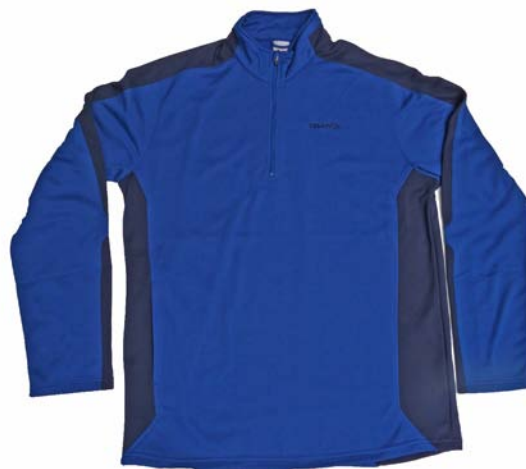
Craft Men's Shift Pullover