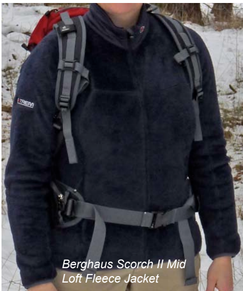
Berghaus Scorch II Mid Loft Fleece Jacket