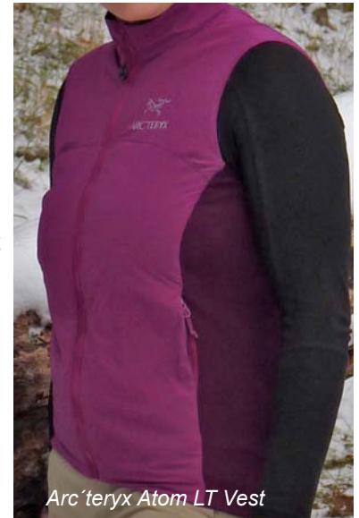
Arc'teryx Atom LT Vest

Innen ist die Jacke mit einer weiteren RV-Tasche ausgestattet. Das Außenmaterial ist DWR behandelt, was zumindest in leichtem Nieselregen oder bei leichtem Schneefall die Nässe abweist.