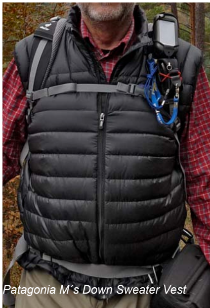
Patagonia M's Down Sweater Vest

Auch unter den beiden im Test vorgestellten Westen der „Isolation-Layer“ möchten wir unseren Favoriten herausstellen: die Leistung von der Patagonia M's Down Sweater Vest und der Arc'teryx Atom LT Vest ist nahezu identisch. Aber auch hier gibt es beim Thema Nachhaltigkeit der Rohstoffe und Produktion Unterschiede.