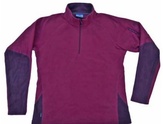
Mountain Equipment Micro Zip-T Fleece