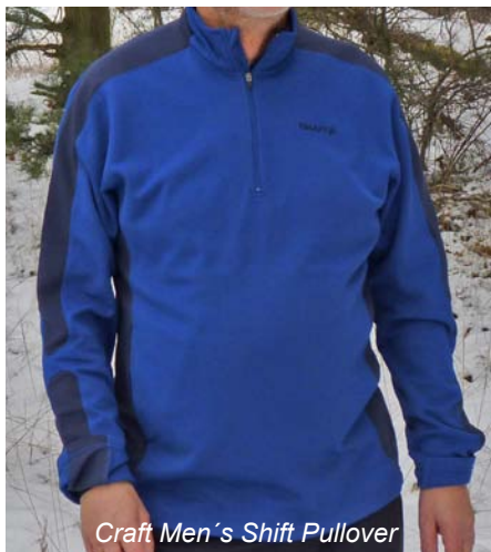
Craft Men's Shift Pullover

Ähnlich sieht es mit dem M's Shift free pullover von Craft aus. Der bequem geschnittene Pullover lässt sich dank 25 cm langem Front-RV problemlos überstreifen. Auch hier sorgt ein Stehkragen mit Zipper-Garage für den Reißverschluss dafür, dass am Hals keine Kältebrücken entstehen können. Das dünne, aber dennoch warme Material besteht aus 100% Polyester und ist mit einer Waffelpiquestruktur verarbeitet. Dank angerauter Innenseite ist der Tragekomfort sehr hoch. Entstehende Feuchtigkeit wird gut in die äußere Kleidungsschicht weitergegeben. Eine seitliche RV-Tasche bietet Platz zum sicheren Verwahren von Kleinigkeiten. Der Pullover ist ideal als wärmende Zwischenschicht, schützt aber nicht vor Wind.