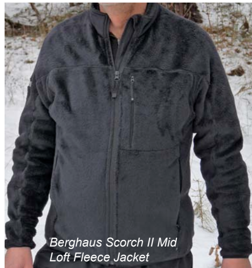
Berghaus Scorch II Mid Loft Fleece Jacket

aus Polartec Thermal Pro gefertigten Jacke ist allerdings ungewöhnlich: das Fleece erhält durch die etwa 0.5 cm langen Fasern auf der Außenseite einen fellartigen Charakter und besticht mit hohem Tragekomfort. Der Kuschelfaktor ist auch dank der flauschigen Innenseite sehr hoch. Die Jacke hat einen durchgehenden Einwege-Front-RV, der am Stehkragen in einer Zipper-Garage ausläuft. Die Krageninnenseite ist sehr flauschig und verhindert zuverlässig das Eindringen von Kälte. 2 sehr große seitliche RV-Taschen mit Netzzinnenfutter wärmen nicht nur die Hände, sondern führen auch Feuchtigkeit nach außen ab. Außerdem können wichtige Utensilien sicher untergebracht werden. Das Herrenmodell ist zusätzlich noch mit einer RV-Brusttasche ausgestattet. Die Jacken eignen sich hervorragend als wärmende Isolationsschicht. An windstillen und trockenen Tagen kann man sie dank der Materialstärke auch als äußere Schicht einsetzen. Ein Windschutz ist aber nicht gewährleistet.