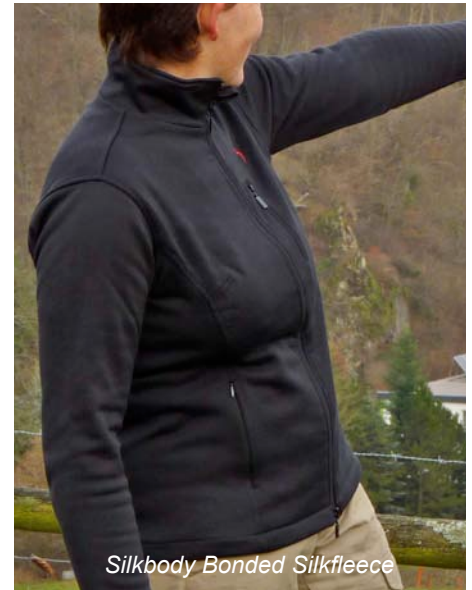
Silkbody Bonded Silkfleece

Bei den klassischen Fleeceprodukten hat uns, obwohl alle 4 Kandidaten gut sind, besonders das Silkfleece von Silkbody überzeugt: zwar hat es Schwächen bei den Pflegeeigenschaften (es braucht länger zum Trocknen), aber es ist den synthetischen Fasern durch die natürliche Geruchshemmung überlegen. Auch unter dem Aspekt der Nachhaltigkeit ist dieses 100% Naturprodukt unser Tipp - schließlich sind wir alle Outdoorfans, da sollte man sich ab und an auch mal Gedanken über die Auswirkungen der High-Tech-Kleidung auf die Umwelt machen. Seide, Wolle und Baumwolle sind, solange die Funktionalität gewährleistet ist und trotz des hohen technischen Aufwandes der auch hinter diesen Naturprodukten steckt, einfach etwas verträglicher als die schließlich aus Erdöl gewonnenen Kunstfasern.