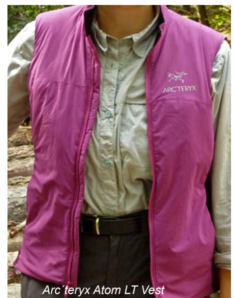
Arc'teryx Atom LT Vest

Wind dringt kaum ein, wobei sich die elastischen Ärmelbündchen der Patagonia Weste positiv bemerkbar machen und auch an diesen Stellen keine Kältebrücken entstehen lassen. Beide Westen bestechen mit federleichten Gewichten und sehr guter Komprimierbarkeit - Platz brauchen beide im Reisegepäck sehr wenig. Arc'teryx hat das Gewicht dadurch noch einmal reduziert, dass an den Seiten, wo per se weniger Wärme entweicht, ungefütterte Stretcheinsätze verarbeitet sind, die die Bewegungsfreiheit optimieren. Das Außenmaterial der Westen ist robust und dem Outdooreinsatz absolut gewachsen.