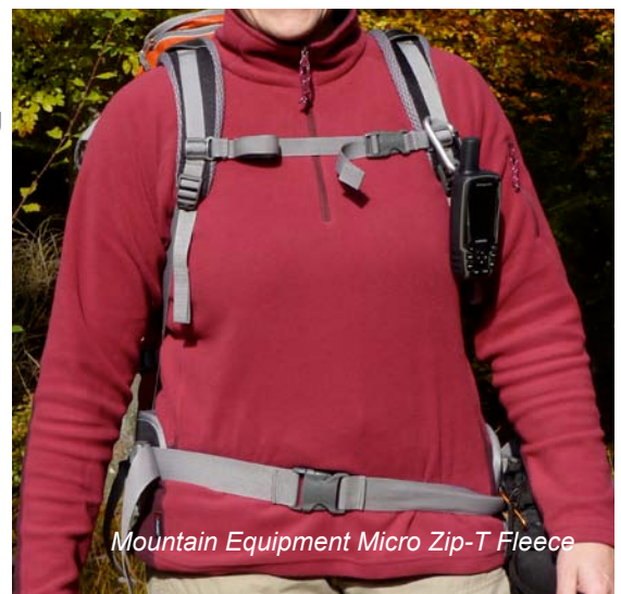
Mountain Equipment Micro Zip-T Fleece

Das Berghaus Fleece und das Mountain Equipment Fleece kann bei kühlen Temperaturen im Trockner getrocknet werden. Wer die Arc'teryx Weste in den Trockner geben möchte, sollte sogar eine noch kältere Trocknungstemperatur wählen. Für die Daunenweste empfiehlt der Hersteller Patagonia die Anwendung eines Trockners bei kühler Temperatur. Das Hinzugeben zweier Tennisbälle optimiert die Trocknung und sorgt für ein gleichmäßiges Auflockern der gewaschenen Daunen.