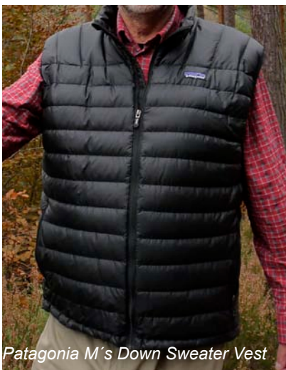
Patagonia M's Down Sweater Vest

Ebenfalls in die Kategorien Mid-Layer und äußere Isolationsschicht für trockenes Wetter gehört die M's Down Sweater Vest von Patagonia . Die zahlreichen Kammern der Weste (auch als Jacke erhältlich) sind mit Gänsedaunen gefüttert, die bei sehr niedrigem Eigengewicht für enorme Wärmeleistung sorgen. Auch die Atmungsaktivität und der Feuchtigkeitstransfer funktionieren sehr gut. Das Außenmaterial der Jacke besteht aus 100% recyceltem Polyester. Die Weste lässt sich eng komprimieren und platzsparend verstauen, auch wenn sie auf den ersten Blick recht voluminös erscheint. Die Frontseite der Weste ist durch ein hinterlegtes Futter winddicht. Das Außenmaterial ist durch eine DWR Behandlung wasserabweisend. Der durchgehende Front-RV endet am Kragen in einer Zipper-Garage. Seitlich gibt es 2 RV-Außentaschen zum Wärmen der Hände oder sicheren Verwahren von Kleinigkeiten. Die große Innentasche ist zugleich als Packtasche für die Jacke nutzbar. Elastisch eingefasste Ärmelausschnitte lassen beim Einsatz als äußere Schicht dem Wind kaum eine Chance zum Körper vorzudringen.