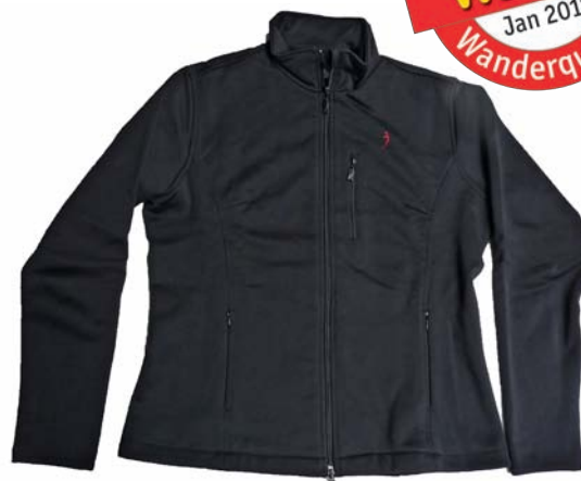
Silkbody Bonded Silkfleece