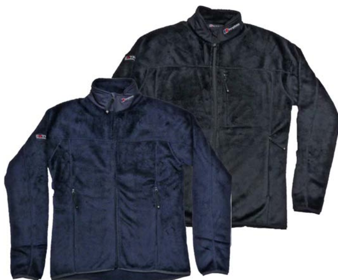
Berghaus Scorch II Mid Loft Fleece Jacket