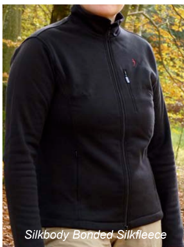
Silkbody Bonded Silkfleece

Dass nicht nur Kunstfasern für wohlige Wärme sorgen beweist das Bonded Silkfleece von Silkbody . Die eigentliche Jacke (auch als Weste erhältlich) besteht aus 100% Seide und besticht durch enorm hohes Wärmepotential. Die angeraute, flauschige Innenseite sorgt für höchsten Tragekomfort. Die Außenseite des Seidenfleeces ist dank der benutzten Materialmischung aus Seide, Wolle und Baumwolle sehr robust und in Verbindung mit der dichten Webart auch noch fast ganz winddicht! Die Jacke hat 2 seitliche RV-Taschen, in denen die Hände gewärmt werden können, oder notwendige Kleinigkeiten Platz finden. Zugleich können die Taschen als offene Inneneinstecktaschen genutzt werden. Eine zusätzliche RV-Außentasche im Brustbereich rundet die Taschenausstattung ab. Der Front-RV ist als Zweiwegereißverschluss ausgelegt. Der Kragen der Jacke verfügt über eine Zipper-Garage und schützt den Hals vor eindringender Kälte. Die Jacke hat ein gutes Feuchtigkeitsmanagement und kann sowohl als wärmende Mid-Layer, als auch (bei trockenem Wetter) als äußere Kleidungsschicht getragen werden. Wind kann nicht eindringen, so dass die Jacke lediglich bei Nässe eine zusätzliche Hardshell verlangt.