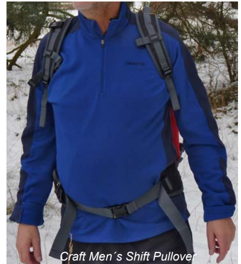
Craft Men's Shift Pullover

Den Pullover von Craft und das Silkbody Fleece sollte man nicht in den Trockner geben. Beim Trocknen des Silkfleeces empfiehlt der Hersteller eine flache Trocknung und auch nur geringes Ausdrücken nach dem Waschen, von festem Auswringen wird abgeraten. Das hat logischerweise Auswirkungen auf die Trocknungszeit, die bei diesem Produkt bei ungünstigen Bedingungen schon mal 2 Tage betragen kann. Alle anderen Produkte im Test sind auch nach einer Handwäsche (und manuellem Auswringen) spätestens nach 1 Tag auf der Wäscheleine wieder einsatzfähig.