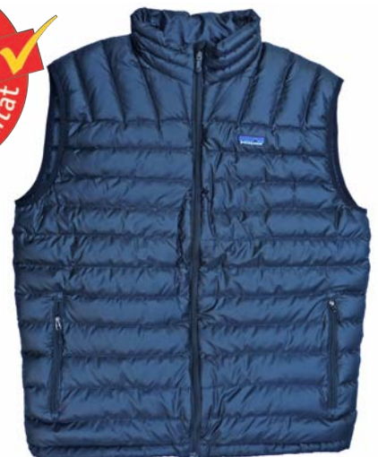
Patagonia M's Down Sweater Vest