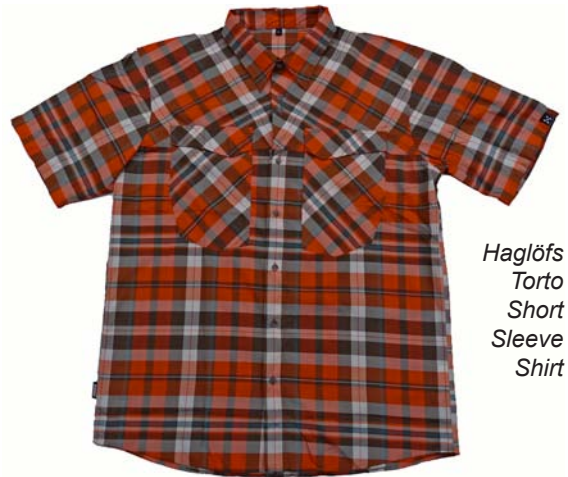
Haglöfs Torto Short Sleeve Shirt