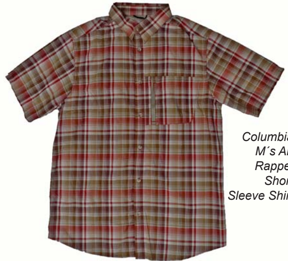
Columbia M's Air Rappel Short Sleeve Shirt