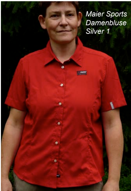
Maier Sports Damenbluse Silver 1

die Produkte nach wenigen Stunden (maximal 5 Stunden nach Handwäsche bei Trocknung im Schatten bei 23°C) wieder in den Einsatz gehen. Bemerkenswert ist dabei v.a. die absolute Knitterfreiheit der Damenblusen von Maier Sports und Patagonia . Doch auch die Herrenhemden von Löffler und Haglöfs wiesen kaum Knitter auf. Lediglich die Hemden von Columbia und Salewa machten einen etwas verknitterten Eindruck, was aber beim Outdooreinsatz nicht wirklich relevant ist.