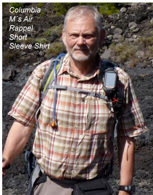
Columbia M's Air Rappel Short Sleeve Shirt

Für sommerliches Wetter eignen sich die drei kurzärmeligen Modelle: die Damenbluse Silver 1 (MPT Serie) von Maier Sports sowie das M's Air Rappel Short Sleeve Shirt von Columbia und das Haglöfs Torto Short Sleeve Shirt .