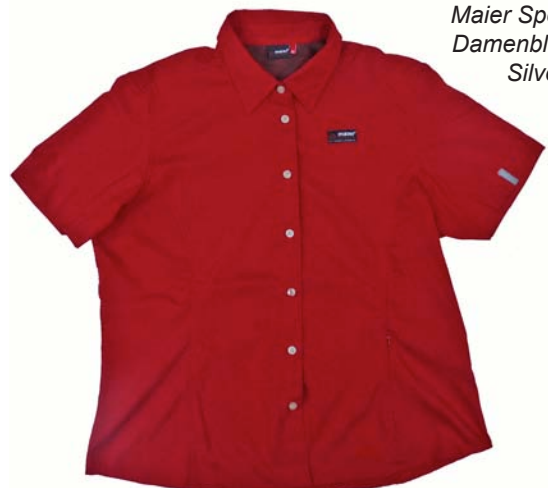
Maier Sports Damenbluse Silver 1