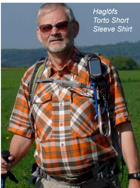
Haglöfs Torto Short Sleeve Shirt