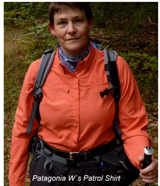
Patagonia W's Patrol Shirt

Gerade bei Alltagskleidung, zu denen Hemden und Blusen beim Wandern gehören, ist das Thema Waschen und Trocknungszeit sehr wichtig. So ist es sehr erfreulich, dass alle sechs Testkandidaten problemlos in der Waschmaschine bei 30°C bzw. 40°C waschbar sind. Die Damenbluse von Patagonia und die Herrenhemden von Salewa , Columbia und Haglöfs können nach dem Waschen im Trockner getrocknet werden. Maier Sports und Löffler sehen dagegen ausschließlich eine Leinentrocknung vor. Absolut erfreulich ist es, wie rasch alle getesteten Blusen / Hemden trocken wurden. Sowohl nach der Maschinenwäsche inklusive Schleudergang, als auch nach der Handwäsche mit Auswringen konnten