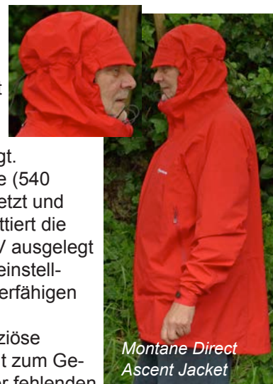
Montane Direct Ascent Jacket

Unser Fazit: Das Montane Direct Ascent Jacket eignet sich gut für lange und stapaziöse Touren auch mit schwerem Gepäck. Durch das robuste Material ist sie allerdings nicht zum Gewichtsparen geeignet. Bei sommerlichen Temperaturen kommt die Jacke aufgrund der fehlenden Zipps an ihre Grenzen, weswegen wir ihr trotz guter Leistung und gutem Preis das Testsiegel vorenthalten.