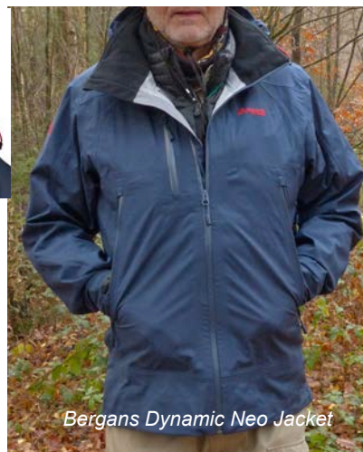
Bergans Dynamic Neo Jacket