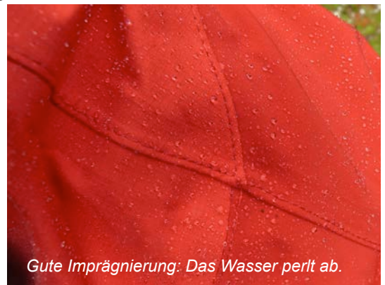
Gute Imprägnierung: Das Wasser perlt ab.

Nach dem Trocknen ist es sinnvoll, den „Abperl-Test“ zu machen: wenn man einige Tropfen Wasser auf das Außenmaterial träufelt und das Wasser nicht mehr abperlt, sondern einen Wasserfilm bildet, ist es Zeit, die Wasserabstoßung des Außenstoffes mit einem geeigneten Imprägniermittel zu erneuern. Hierzu kann man Sprays oder Mittel zum Einwaschen (auch als Kombipräparat mit dem Waschmittel) nutzen. Letztere kommen vor dem Trocknen zum Einsatz und sind nicht so individuell einsetzbar wie Sprays.