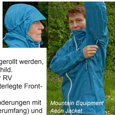
Mountain Equipment Aeon Jacket

Unser Fazit: Das Mountain Equipment Aeon Jacket eignet sich prima bei Wanderungen mit möglichem Niederschlag. Es ist leicht und sehr klein packbar (Packsack im Lieferumfang) und hat ein sehr gutes Preis-Leistungsverhältnis. Die etwas künstliche Haptik auf der Innenseite und die Überlegenheit der Mitkonkurrenten im Dampftest verhindern eine Auszeichnung mit dem Testsiegel.