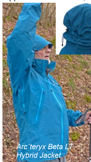
Arc'teryx Beta LT Hybrid Jacket

Der nächste Kandidat ist das Beta LT Hybrid Jacket von Arc'teryx . Die Jacke begeistert durch die Leichtgewichtigkeit und die sehr gute Dampfdurchlässigkeit, die durch eine Kombination aus zwei GORE-TEX® Membranen (Paclite und Active, beide aus PTFE) erreicht wird. Das etwas raschelige Außenmaterial ist recht robust. Die Jacke ist mit einer sehr gut einstellbaren Kapuze ausgestattet, wobei der Schild etwas stabiler sein könnte. Die beiden RV Außentaschen sind angenehm hoch angesetzt, so dass auch ein geschlossener Rucksackhüftgurt keine Einschränkung der Zugriffsmöglichkeit mit sich bringt. Die RVs selbst sind wasserfest.