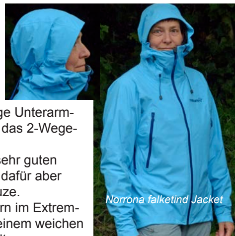
Norrona falketind Jacket

Unser Fazit: das falketind Jacket von Norrona ist eine strapazierfähige 3-Lagen Jacke, die auch andauerndem Regen gut trotzt. Leider lässt sich die Kapuze weder verstauen noch abnehmen. Auch das wenig umweltfreundliche Membranmaterial PTFE führt dazu, dass einige Mitkandidaten insgesamt etwas besser abschneiden. Daher erhält die Norrona Jacke knapp kein Testsiegel.