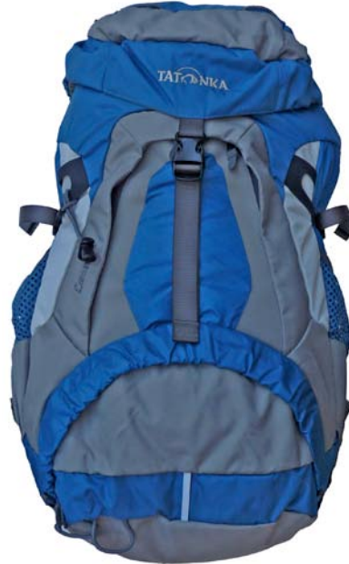
Tatonka Leon 38