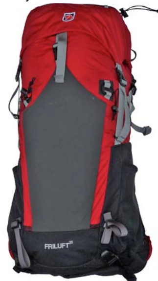
Fjällräven Friluft 35