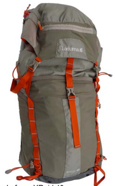
Lafuma XRaid 40

Gewicht: 1080 g Ladenpreis: 115,00 € www.lafuma.com