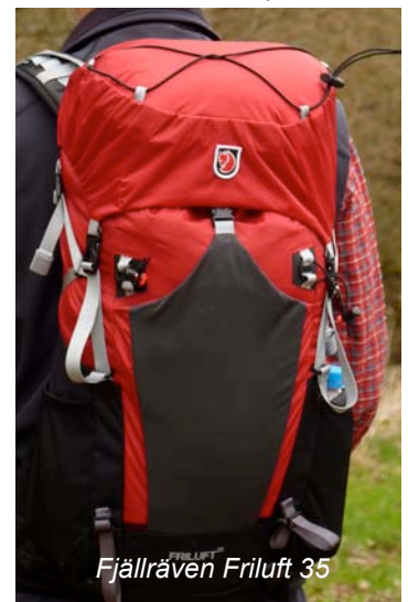
Fjällräven Friluft 35