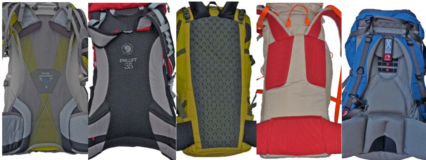
Deuter Spectro 32

Als Einzige bieten die beiden Tatonka Modelle die Möglichkeit der Längenverstellung: beim X-Lite Vario System