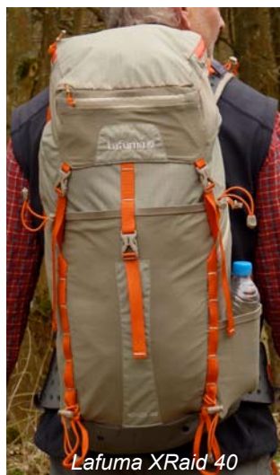
Lafuma XRaid 40

Fassungsvolumen der Testmodelle deckt den Bereich von 28 bis maximal 40 Liter ab.