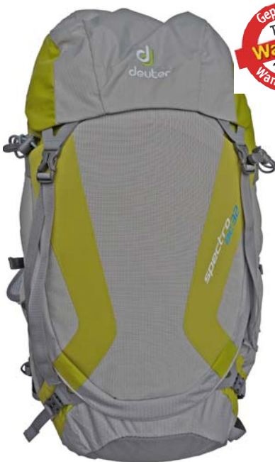
Deuter Spectro 32