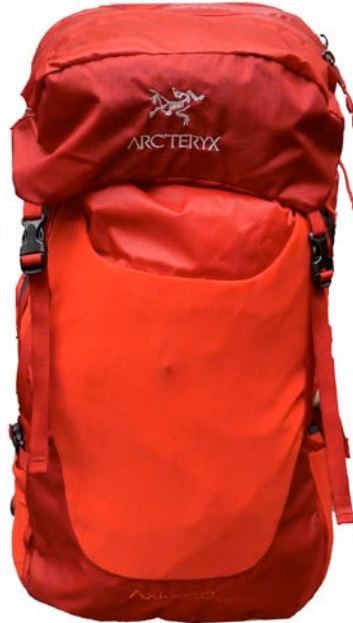
Arc'teryx Axios 33