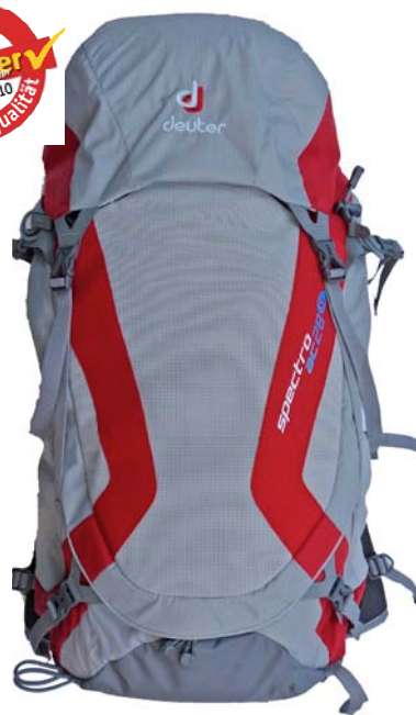
Deuter Spectro 28 SL