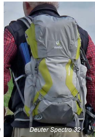
Deuter Spectro 32

Mit 1130g bzw. 1150g sind die beiden Spectro Rucksäcke von Deuter nur unwesentlich schwerer als der Lafuma . Die soliden aber leichtgewichtigen Tagesrucksäcke bieten mit 28 Litern beim Damenmodell 28 SL und mit 32 Litern beim Herrenmodell mehr als genug Platz für eine ausgiebige Tagestour. Der elastische Rahmen mit dem Rückennetz gibt den Spectro Rucksäcken eine sehr gute Stabilität und sorgt für gute Rückenbelüftung. Das große Hauptfach ist sowohl von oben, als auch von vorne per Doppelreißverschluss zugänglich. Seitliche Netzaußentaschen bieten Trinkflaschen Platz, wer möchte kann aber auch ein Trinksystem nutzen, denn eine Beutelaufhängung und Schlauchdurchführung sind vorhanden. Außen am Hauptfach findet sich ein zentrales, oben per Clip verschließbares Netzfach, das beispielsweise nasse Kleidung aufnehmen kann, ohne den restlichen Rucksackinhalt zu durchnässen. Das Deckelfach besitzt innen einen Aufdruck mit den wichtigsten Notsignalen. Außen gibt es ein RV Deckelfach. Die Hüftflossen sind breit und sehr gut gepolstert. Beim Damenmodell Spectro 28 SL ist der Hüftgurt übrigens ebenso wie die