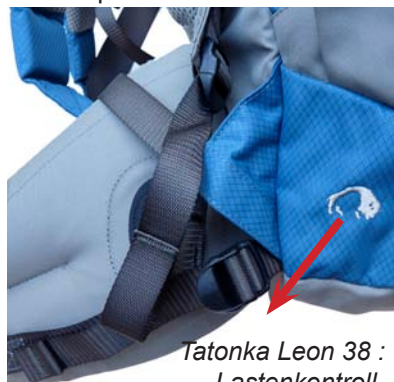
Tatonka Leon 38 : Lastenkontroll- riemen am Hüftgurt

Bei Deuter und Fjällräven sorgen integrierte Stäbe für diese Gewichtsübertragung. Tatonka und Arc'teryx nutzen im Rückenteil eingebaute Kunststoffplatten, um die Schultern zu entlasten und das Gewicht auf die Hüfte zu bringen. Der Lafuma hat kein steifes Übertragungssystem. Hier erfolgt die Lastenverteilung ausschließlich über die weichen Rückenpolster.