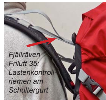
Fjällräven Friluft 35: Lastenkontroll- riemen am Schultergurt

Auch die korrekte Handhabung der diversen Lastenkontrollriemen trägt zu einer optimalen Austarierung des Rucksacks und damit zum Tragekomfort bei. Solche Lastenkontrollriemen gibt es bei allen acht Testrucksäcken an den Schultergurten. Sie sollten bei beladenem und richtig aufgesetztem Rucksack angezogen werden. Bei zu losen Schulterkontrollriemen, kann v.a ein hoch aufragender Rucksack ins Schwanken kommen und unnötig Kräfte beanspruchen.