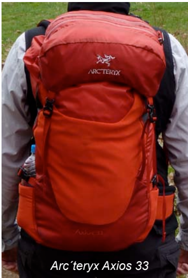
Arc'teryx Axios 33

Schultergurte für die weibliche Anatomie optimiert.