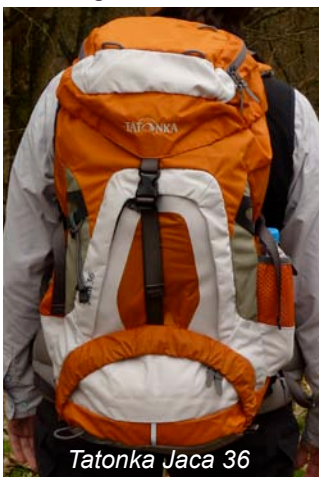
Tatonka Jaca 36

Für aufwenige Tagestouren, v.a. aber für längere Wandervorhaben und speziell auch für Pilgertouren sind die beiden Tatonka Modelle Jaca 36 (für Damen) und Leon 38 (für Herren) entwickelt worden. Die sehr robusten Tourenrucksäcke bieten im geräumigen Hauptfach viel Platz. Dieses ist von oben und auch frontal per Reißverschluss zugänglich. Im unteren Teil befindet sich ein weiteres Staufach, das innen per Reißverschluss mit dem großen Hauptfach verbunden ist. So kann man z.B. feuchte Kleidung effektiv vom Rest des Gepäcks trennen. Seitlich gibt es zwei große Netzaußentaschen. Das Deckelfach ist mit einer großen RV- Außentasche ausgestattet, in der gut zugänglich auch die Regenhülle im Beutel eingeklinkt ist. Das X-Lite Vario Rückensystem lässt sich in 4 unterschiedlichen Größen einstellen und so individuell an die Rückenlänge anpassen. Polster sorgen für gute Belüftung bei gleichzeitig guter Lastenkontrolle. Dazu trägt auch der sehr breite und hervorragend gepolsterte Hüftgurt bei. Wie bei Deuter und Arc'teryx ist das Damenmodell für die weibliche Anatomie optimiert.