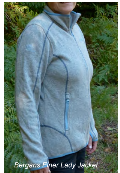
Bergans Einer Lady Jacket

Anders sieht das beim 2. Kandidaten in der Woll-Gruppe aus, dem Einer Lady Jacket von Bergans . Diese Jacke kombiniert 40% Wolle mit einer Kunstfasermischung. Heraus kommt ein optisch wie haptisch ansprechendes Produkt mit relativ glatter aber deutlich wolliger Oberfläche und weicher Innenseite. Die Jacke bietet 2 RV Außentaschen, die auch mit Hüftgurt gut zugänglich sind. Leider ist das Futter der beiden Taschen auf der Innenseite nicht komplett angenäht, so dass eine zusätzliche Nutzung als offene Innentasche nicht möglich ist. Das Einer Lady Jacket bietet eine hohe Wärmeleistung und dank des dehnbaren Gewebes auch eine sehr gute Bewegungsfreiheit. Die Ärmel haben elastischen Ärmelbündchen und Daumenöffnungen. So kann (ähnlich wie beim Power Houdi) ein Teil der Hand noch vom Ärmel abgedeckt und gewärmt werden, ohne die Bewegungsfreiheit der Hand einzuschränken. V.a. beim ersten Waschen kommt es, ähnlich wie beim Fjällräven-Fleece, zur Freisetzung von Wollfusseln, allerdings in erheblich geringerem Ausmaß und daher noch akzeptabel. Die solide verarbeitete Jacke mit gutem Preis-Leistungsverhältnis ist ein gelungener Mix aus Natur- und Synthetikmaterial mit zwar weicher und guter, aber noch steigerungsfähiger Haptik. Daher bleibt der Bergans Jacke eine Auszeichnung mit dem Testsiegel verwehrt.