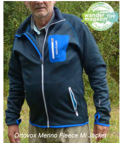
Ortovox Merino Fleece Mi Jacket

Das holt sich dagegen das Merino Fleece Mi Jacket von Ortovox . Das hat zwar „nur“ 27% Merinowollanteil, die sind aber so verarbeitet, dass sie an der Innenseite zum Tragen kommen, wo der Kontakt zur Haut am nächste ist. Die Außenseite ist glatt und strapazierfähig und daher ist die Jacke bei Bedarf auch als äußerste Kleidungsschicht einsetzbar. Innen besticht die Jacke mit samtweicher Oberfläche, die den Feuchtetransfer unterstützt und zugleich mollige Wärme spendet. Die beiden RV Seitentaschen mit Netzfutter sind bei geschlossenem Rucksack-Hüftgurt nicht perfekt, aber noch gut erreichbar. Da das Futter der Taschen innen komplett vernäht ist, hat man so zugleich zwei offene Innentaschen zur Verfügung. Eine nahtfreie Brust-RV Außentasche rundet die Ausstattung ab. Die etwas länger gezogenen Ärmel enden in elastischen Bündchen und bieten Daumenöffnungen. So kann auch an dieser Jacke der Handrücken vom Ärmel abgedeckt und gewärmt werden, während die Finger und der Daumen Bewegungsfreiheit haben. Die bietet übrigens auch die Jacke selbst in perfektem Umfang. Bei der Pflege ist das Merino Fleece von Ortovox unproblematisch, auch die Trocknungszeit auf der Leine ist absolut akzeptabel. Alles in allem hat sich das Merino Fleece Mi Jacket im Test sehr gut bewährt und bringt alle Eigenschaften mit, die man sich beim Wandern wünscht. Auch das Preis-Leistungsverhältnis stimmt. Daher erhält diese Ortovox Jacke das Testsiegel des Wandermagazins.