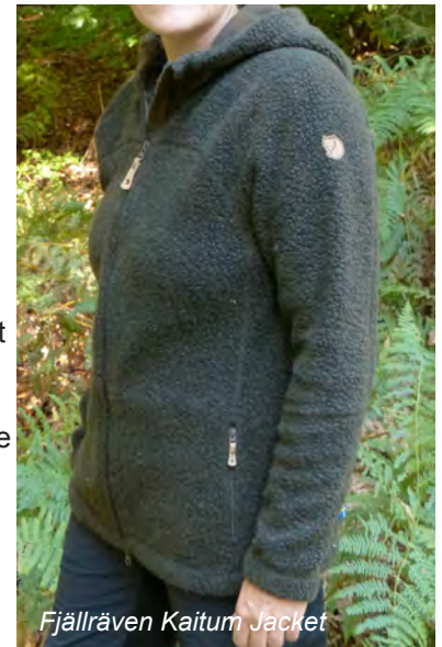
Fjällräven Kaitum Jacket

Eigentlich schwarzes Microfleece mit Fusseln des Kaitum Fleece